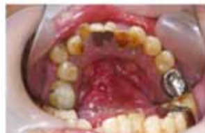
たばことお酒 ⇒口底がん