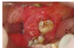
歯を磨かない ⇒歯肉がん